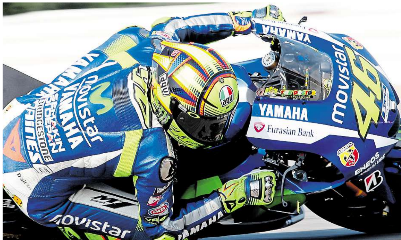
Padesátá brněnská show. Zatímco jezdci včera trénovali na Grand Prix, do kempů v okolí okruhu se sjížděly desetitisíce fanoušků. Někteří z nich na závod jezdí už desítky let. Více čtěte na straně 14

Čadek zaútočil na vlivného poradce ministra vnitra Miloše Růžičku, spolujednatel PR agentury Bison & Rose. „Disponuji materiály, které jasně ukazují na totální rozvrácenost celého ministerstva vnitra. Jde o propojenost s firmou Bison & Rose.“ říká Čadek v rozhovoru pro LN. Pokračování na straně 2